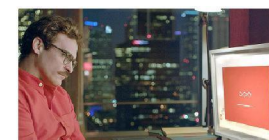
Quarantaine & chill? Dit is hoe je date ten tijde van de coronacrisis Met de hulp van de GGD en de ANBO, de ANBO of de Luisterlijn

De quarantainecoaches zijn een uitbreiding van de begeleiding en hulp die er nu al is voor mensen die in quarantaine zitten/waaiten. GGD-medewerkers bezoeken in hun gesprekken in het kader van telefonische en online ondersteuning al van dichtbij de sociale en praktische dilemma's. En zij verwijzen naar hulplijnen van bijvoorbeeld het Rode Kruis, de ANBO of de Luisterlijn en naar websites van hulporganisaties. Ook is er de quarantainegids met praktische tips en